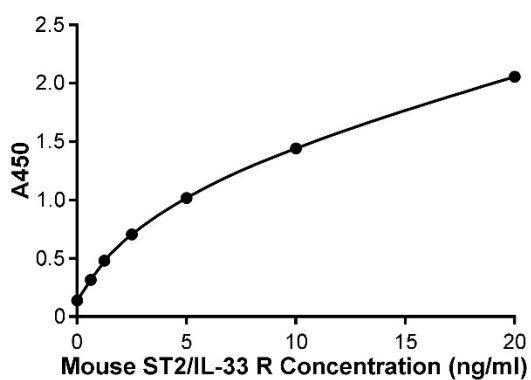
图3. Mouse ST2/IL-33 R ELISA Kit的标准曲线。实测数据会因实验条件、检测仪器等的不同而存在差异，图中数据仅供参考。

d. 若样品OD值高于标准曲线上限，应适当稀释后重新测定，计算浓度时需注意乘以样品的稀释倍数。